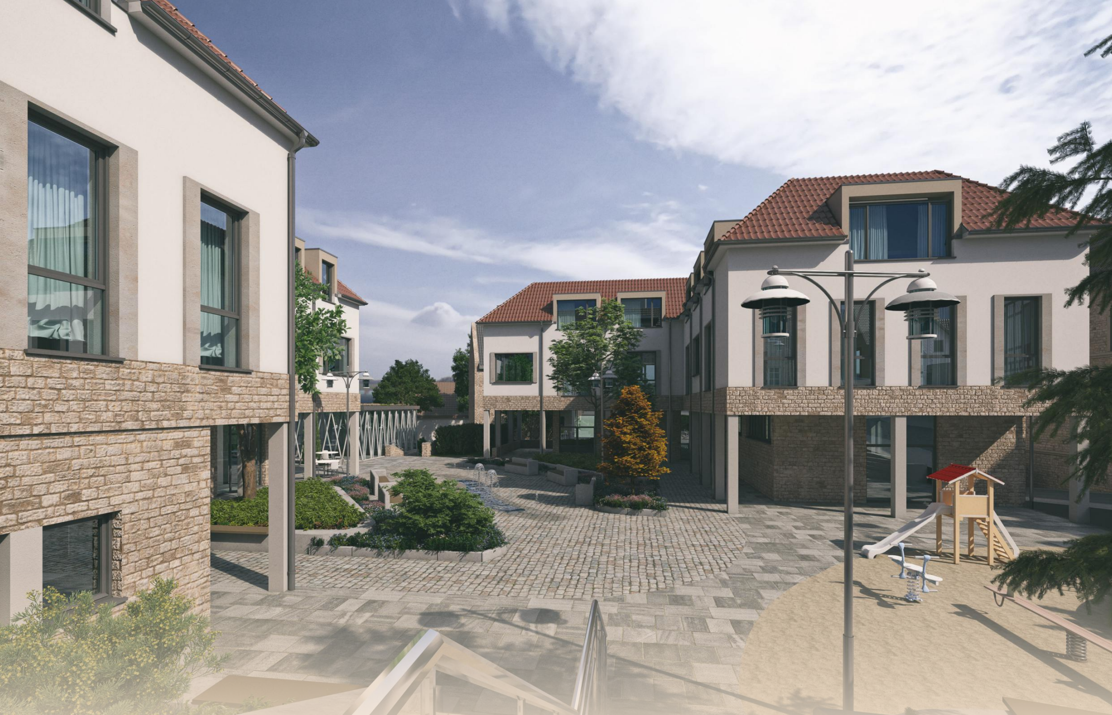
Nordzugang über Treppenanlage