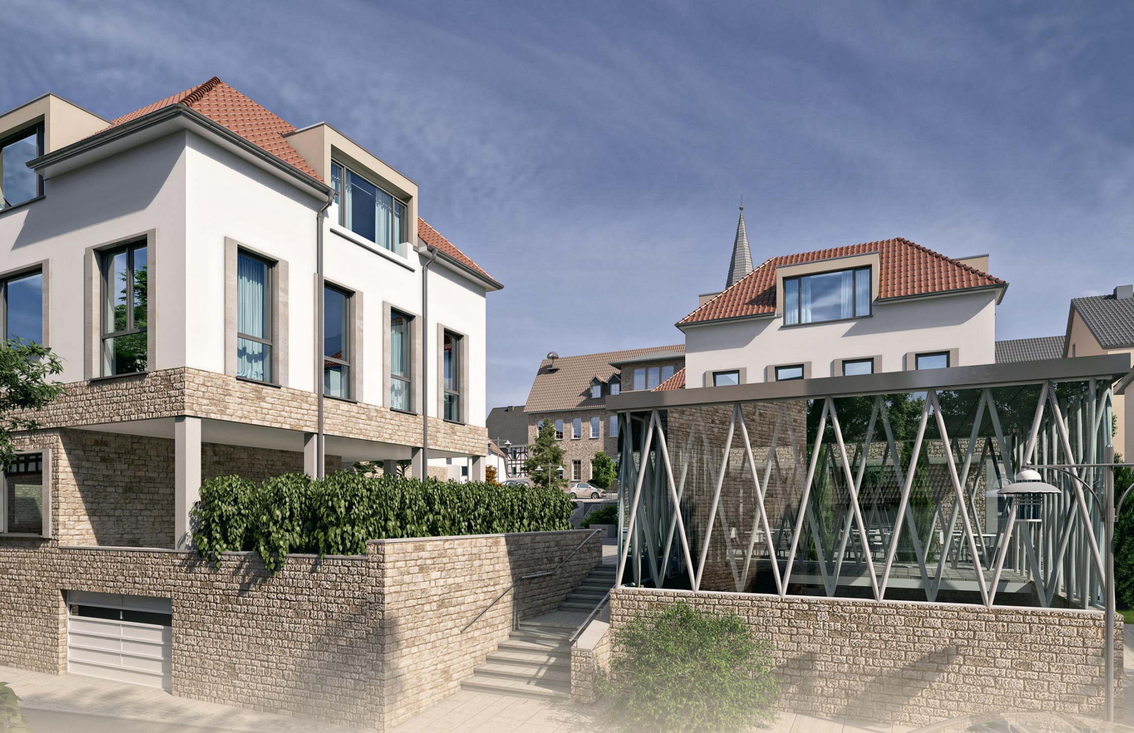
Treppenzugang von Süden