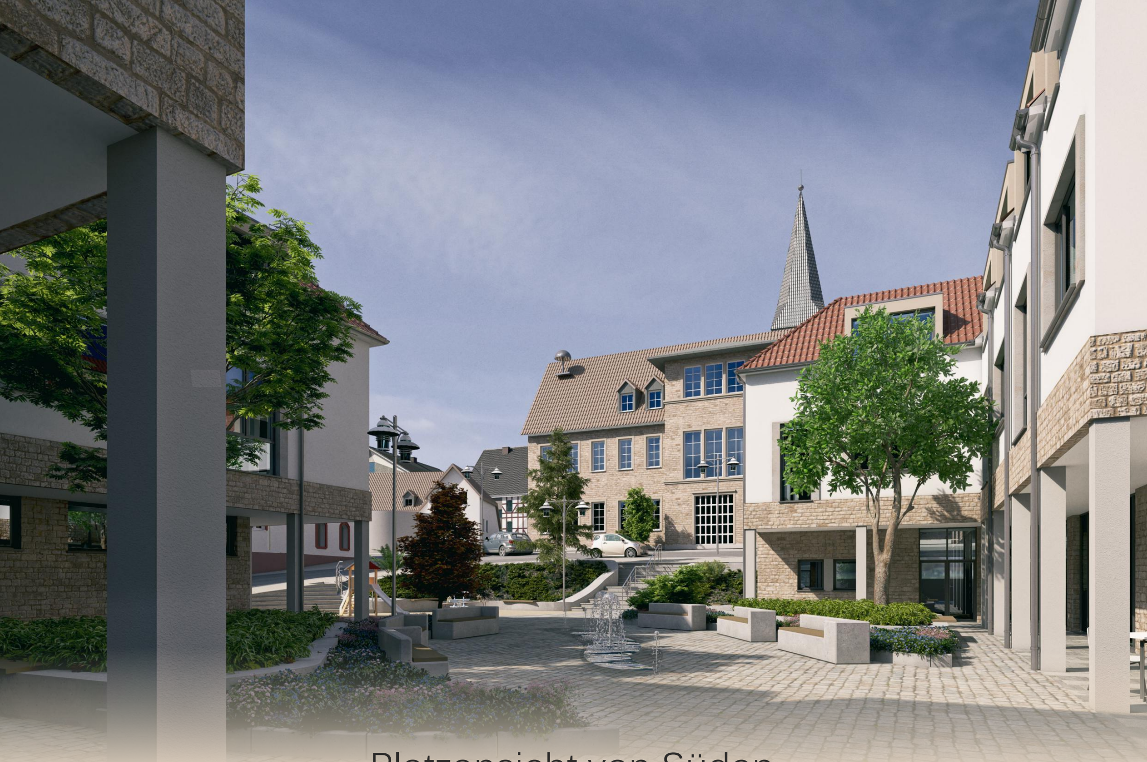
Platzansicht von Süden